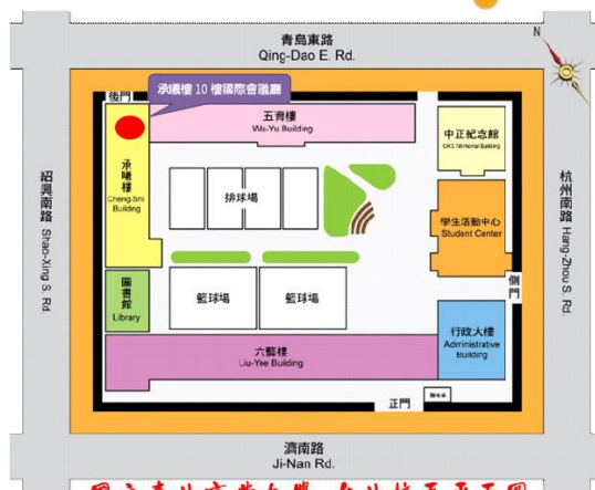
國立臺北商業大學-台北校區平面圖