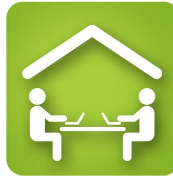
進駐使用Startup Lab 703 Co- working space