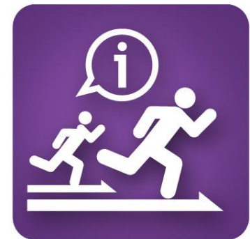
其他創業競賽 相關資訊