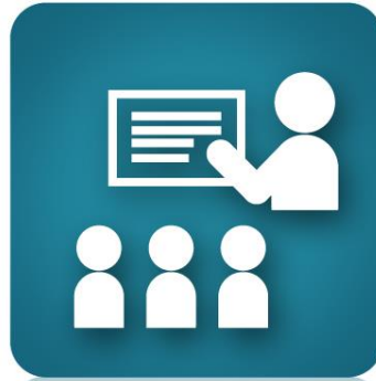
優先參與 專業課程、講座