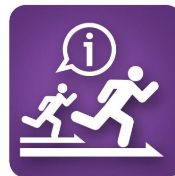
其他創業競賽 相關資訊