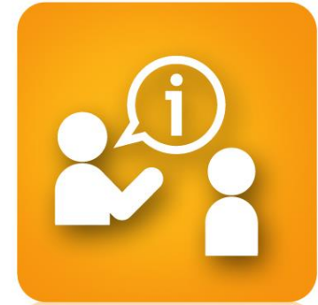
使用財務、法務 專利等諮詢服務